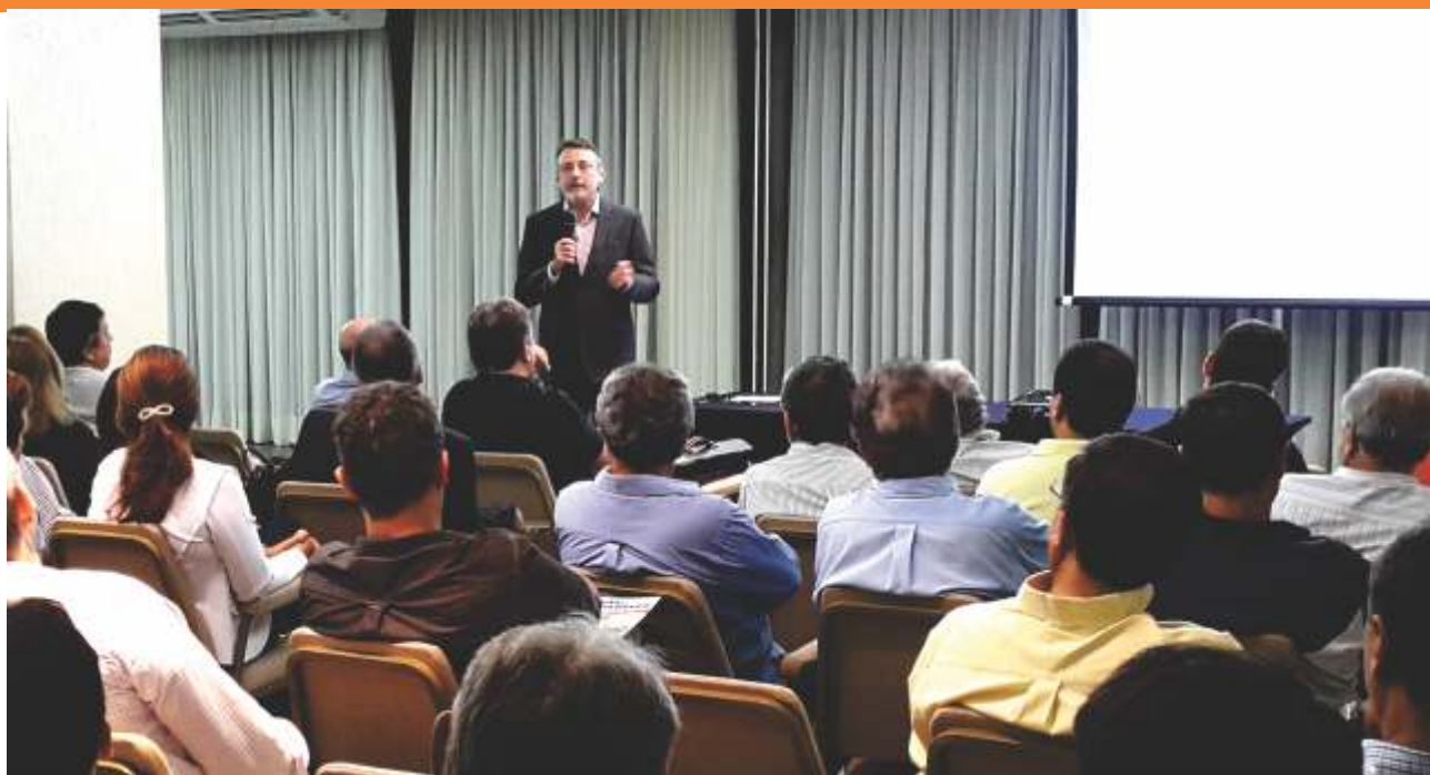
Revendedores debatem futuro do país mediante o provável Impeachment de Dilma Rousseff