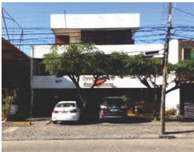
Novo endereço trará mais comodidade para os usuários da Comissão

A advogada lembra, no entanto, que alguns Juízes entendem que o termo de conciliação firmado teria o mesmo alcance da homologação da rescisão perante o Sindicato Obreiro.