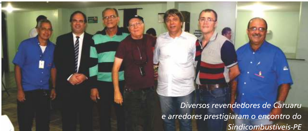
Diversos revendedores de Caruaru e arredores prestigiaram o encontro do Sindicombustíveis-PE

da Agência após a criação de seu banco de dados, gerando antecedentes que implicam em maior gravidade nas punições em caso de irregularidades. «Além da penalidade da multa, há o agravamento devido à reincidência», disse, alertando que é possível até a revogação do registro, o que implica no impedimento da continuação do exercício da atividade. De acordo com ele, dois postos revendedores na RMR e um no interior já chegaram nesses extremos. «É preciso ter cada vez mais controle tanto na quantidade quanto na qualidade dos combustíveis, com relação aos índices de conformidade. Esta é uma preocupação que precisa estar no dia a dia do revendedor», orientou ele. O assessor jurídico tratou também da atual dificuldade