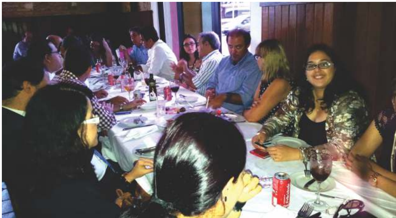
Cerca de 20 representantes de veículos de comunicação participaram do evento

Dentro do programa de comunicação do Sindicombustíveis-PE, a entidade promoveu no dia 18 de dezembro, no restaurante La Douane Bistrot, no Shopping Paço Alfândega, um almoço de confraternização com jornalistas e gerentes da área comercial dos principais jornais do estado de Pernambuco, além de rádios locais, como a CBN. Na ocasião, os participantes e a diretoria do sindicato tiveram a oportunidade de interagir de forma mais espontânea promovendo o fortalecimento do vínculo entre a entidade e os formadores de opinião. Outro objetivo do encontro festivo foi repassar para a mídia um balanço do setor em 2013 sob a ótica do Sindicombustíveis-PE.