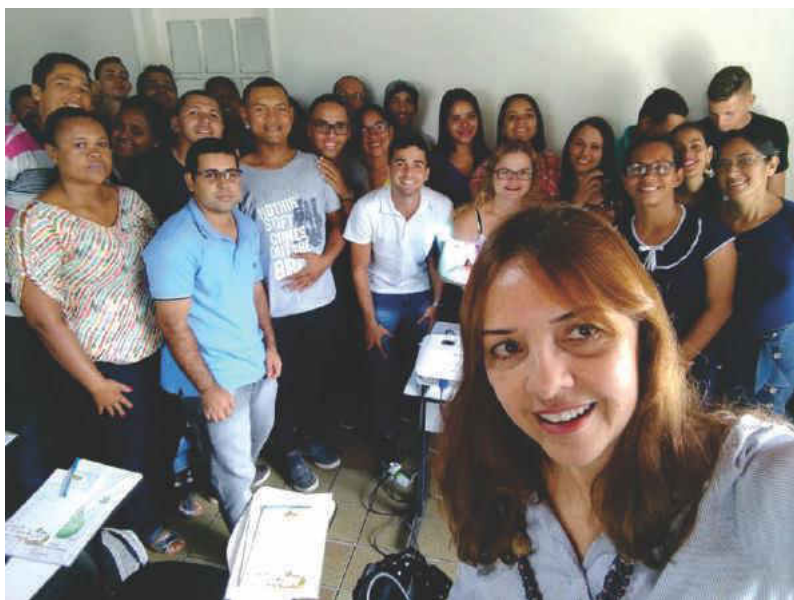
Turma no Recife participa do curso