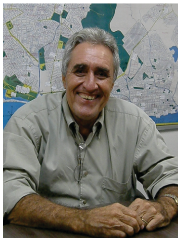
Frederico Aguiar Presidente

O reforço nas palestras e eventos com o objetivo de esclarecer o revendedor sobre acontecimentos relevantes para a condução dos seus negócios também tem sido bem recebido pela categoria. Por fim, vale destacar o empenho do Sindicombustíveis-PE no sentido de se posicionar diante da sociedade, das distribuidoras, dos produtores de combustíveis e do poder público sobre os aumentos abusivos dos preços praticados, um problema que encontra guarida em todo o país e é tratado aqui nesta edição do Posto Notícias.