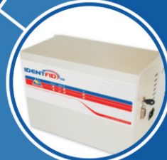
AUTOMAÇÃO DE BOMBAS