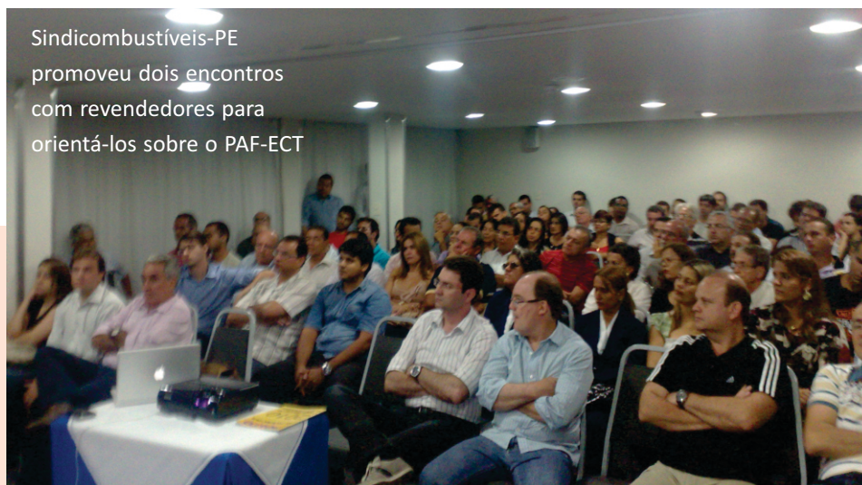
Sindicombustíveis-PE promoveu dois encontros com revendedores para orientá-los sobre o PAF-ECT

postos, que pressupõe o uso exclusivo de bombas eletrônicas. Inclusive a Sefaz vai exigir o cumprimento do art. 7º da Lei Estadual nº 12.642 de 13.11.2003, que determina a obrigatoriedade do uso de Bomba de Abastecimento Eletrônica e conseqüentemente à proibição do uso das Bombas de Abastecimento Mecânicas.