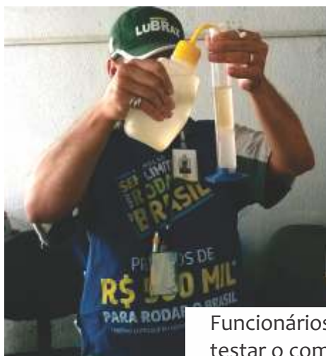
Funcionários aprendem a testar o combustível recebido

receptividade nos postos também tem sido boa. De acordo com o Sindicombustíveis-PE, Pernambuco dispõe de 1.300 postos revendedores de combustíveis cadastrados, com uma maior concentração na Região Metropolitana do Recife.