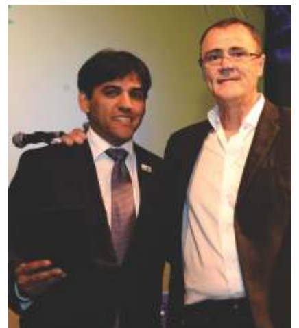
Que, por sua vez, recebeu de Casale