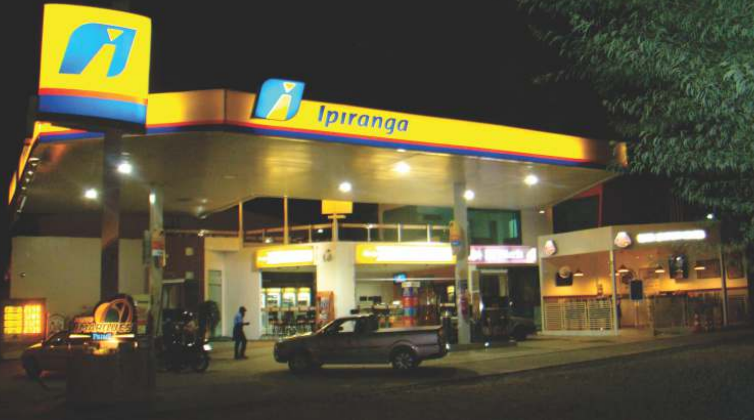
Posto Limarques II, em Cabrobó, se destaca pela arquitetura moderna e enxuta, com bar temático da Ar