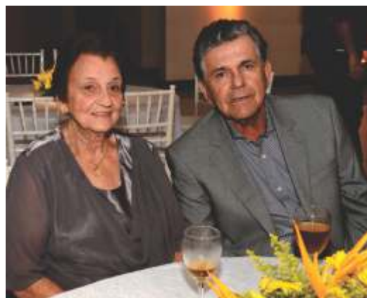
Orlando e esposa