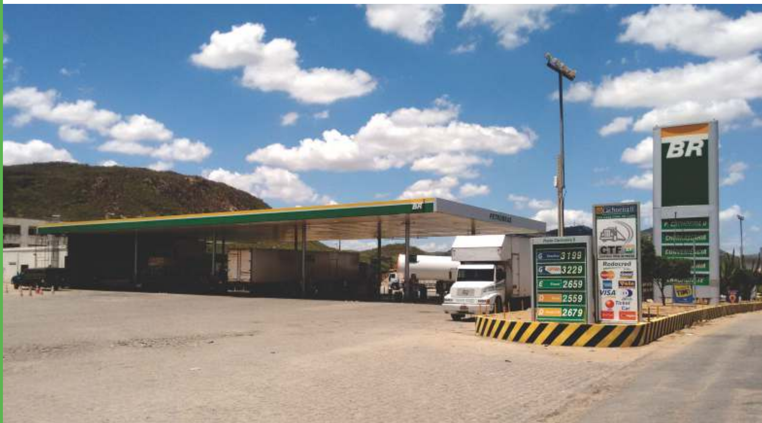
Posto Cachoeira II, em Salgueiro, oferece espaço amplo para caminhoneiros às margens da BR