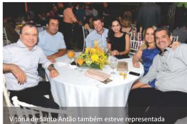
Vitória de Santo Antão também esteve representada