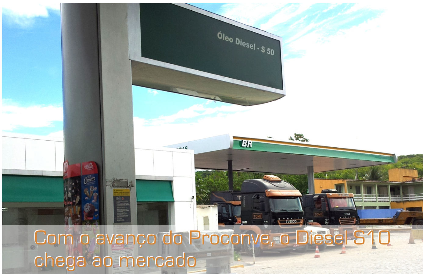
Com a chegada do S10, Diesel S50 deixará de ser comercializado

Em 2013, o Programa de Controle da Poluição do Ar por Veículos Automotores - Proconve avança mais um estágio com a chegada do diesel S50. A partir de janeiro, os veículos fabricados a partir do ano especificado passarão a usar exclusivamente o Diesel S10.